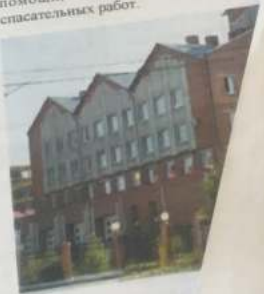
Здание БУ ХМАО-Югры

Для оказания оперативной помощи чрезвычайных ситуациях, авариях на автомобильном и железнодорожном транспорте, авиакатастрофах, стихийных бедствиях, для проведения спасения пострадавших в лесных зонах на реках и водоемах и проведения других связанных со спасением людей и оказанием помощи, создано управление спасательных работ.